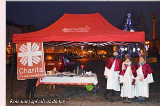
Koledníci zpívali až do tmy.