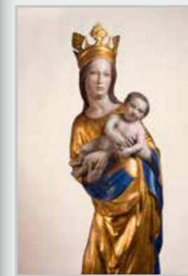
Fotografie na titulní straně časopisu: Madona ze Slatiny pod Hazmburkem (kolem 1375-1385)