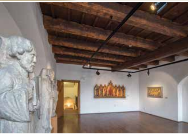
Galerie a muzeum litoměřické diecéze