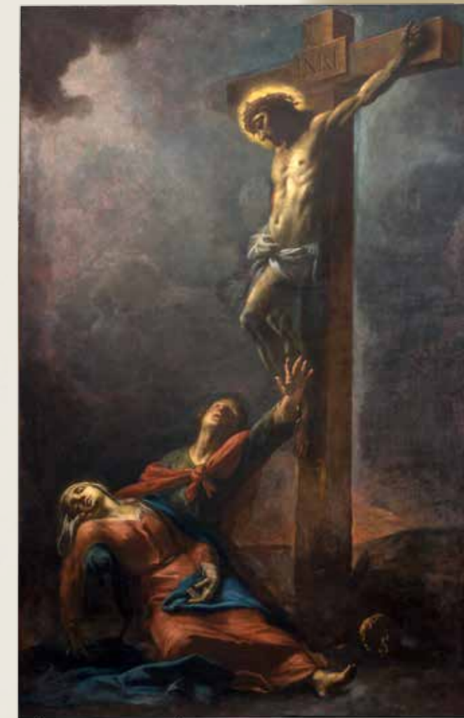
Ukřižovaný Kristus s Bolestnou Pannou Marií a Janem z Dolního Slivna (Petr Brandl, kolem 1731).

Inspiraci obrazem sv. Matouše s andělem od Karla Škréty z Křešic (jž výše zmíněného) ukazují další tři obrazy shodné tematiky, z nichž ten, který pochází z kazatelny katedrály