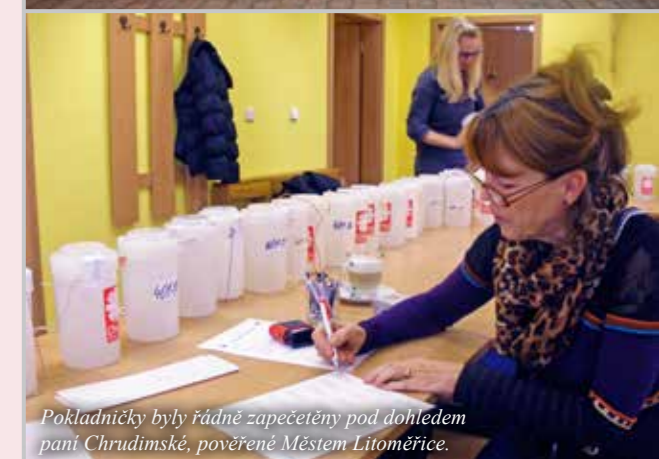
Pokladničky byly řádně zapečetěny pod dohledem paní Chrudimské, pověřené Městem Litoměřice.