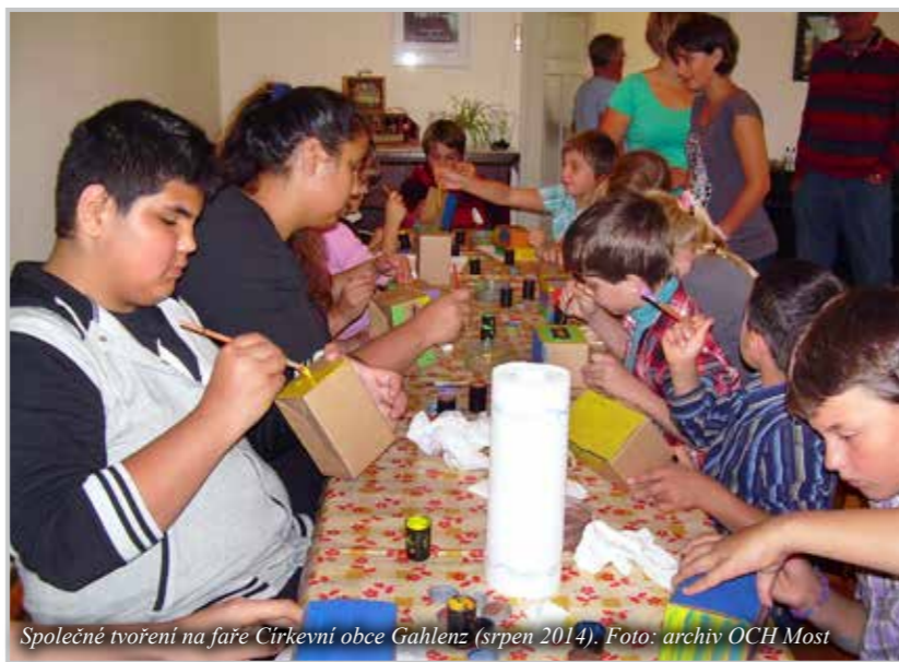
Společné tvoření na faře Církevní obce Gahlenz (srpen 2014).

Letošní plán přeshraničních akcí, které se všechny uskuteční v rámci patnáctého výročí, obsahuje tradiční aktivity v oblastech výměny profesních zkušeností, kulturně-vzdělávací, sportovní-zábavné i poznávací.