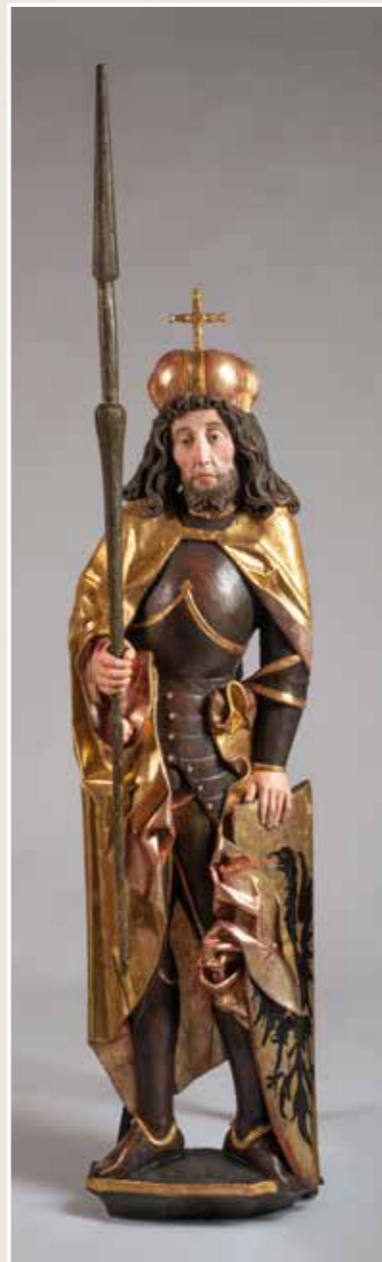
Sv. Václav z Libědic (konec 15. století).