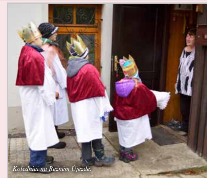
Koledníci na Režném Újezdě.

Připravila Edith Kroupová, Diecézní charita Litoměřice