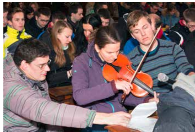
Vpravo: Bělá pod Bezdězem