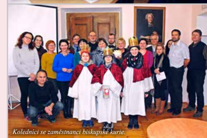
Koledníci se zaměstnanci biskupské kurie.