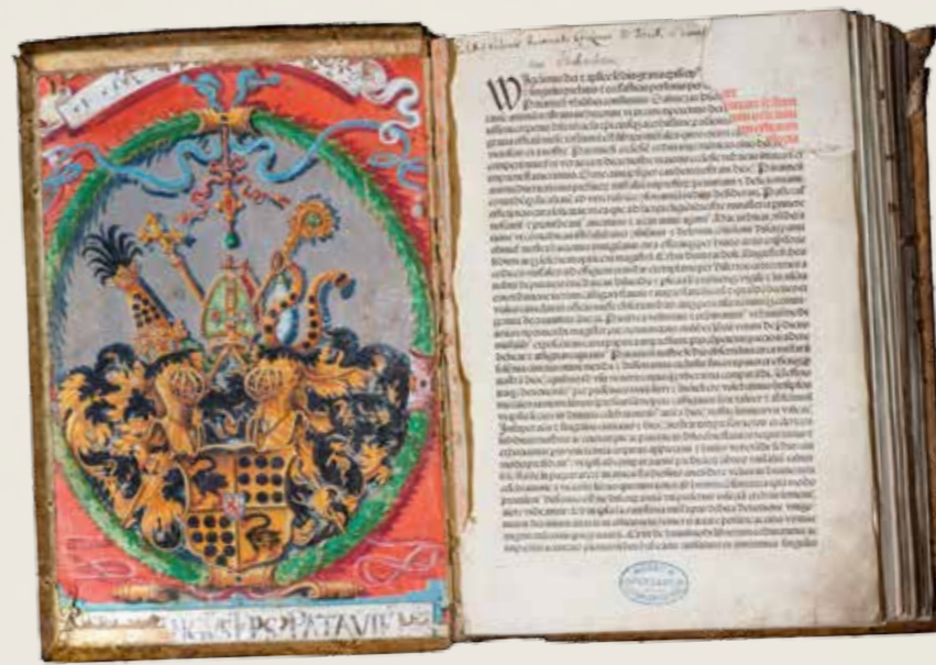
Pasovský misál ze sbírek Diecézního muzea (1505).