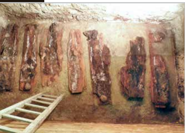
Před hlavním oltářem kostela sv. Antonína Velikého v Liberci našli archeologové zavalenou kryptu, o jejíž existenci nikdo dosud nic netušil. Po oděžení několika metrických centů zeminy se objevilo devět rakví. Ostatky zřejmě patří někdejšími měšťanům.

Kostel sv. Antonína Velikého v Liberci prochází generální opravou. Aby farnost mohla uhradit spoluúčast k dotaci, vyhlásila sbírku „Kup si svůj m 2 “. Od září loňského roku se na účet sbírky sešlo zhruba čtyři sta tisíc korun.