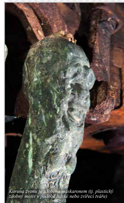
Koruna zvonu je zdobena maskaronem (tj. plastický zdobný motiv v podobě lidské nebo zvířecí tváře)

Uprostřed obce Holany na Českolipsku, na svérázně vyvýšenině, byl ve 2. polovině 18. století postaven nádherný barokní kostel sv. Máří Magdalény, jehož návštěva je potěšením pro všechny obdivovatele vrcholně barokního sakrálního umění. Už jen samotná koncepce stavby svědčí o tom, že architekt se nechal inspirovat odkazem stavitelů Luragových, od nichž některé charakteristické architektonické a výtvarné prvky převzal bez větších změn.