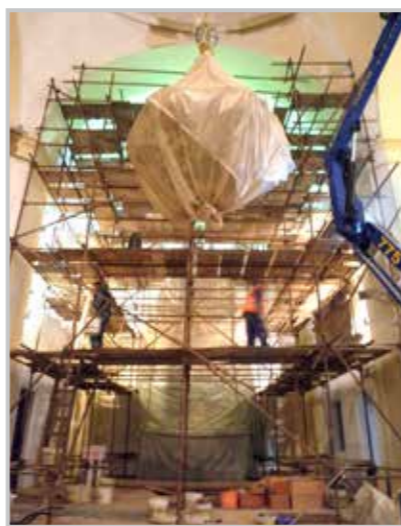
Interiér kostela v průběhu rekonstrukce. Projekt je podpořen z Regionálního operačního programu ROP NUTS II Severovýchod

Při požáru věže 16. června 1787 byly roztaveny všechny čtyři zvony a věž zcela zničena. Liberečtí občané mezi