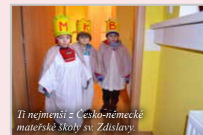
Ti nejmenší z Česko-německé mateřské školy sv. Zdislavy.

S Tříkrálovou sbírkou je každoročně spojeno nespočet nejrůznějších akcí, zejména pro koledníky. Například v Nizkoprahovém zařízení Ambrela ve Šluknově vyhlásili výtvarnou soutěž na téma Tři králů, jejíž výsledky byly slavnostně vyhlášeny na tříkrálové besídce určené rovněž tříkrálovým koledníkům. S Tříkrálovou sbírkou se pak společně rozloučili při hudbě a soutěžích.