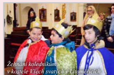
Žehnání koledníků v kostele Všech svatých v Litoměřicích.

Dalších 15 % výnosu sbírky připadá na projekty diecézních charit v České republice, 10 % výnosu sbírky bude věnováno na humanitární pomoc do zahraničí, kdy Diecézní charita Litoměřice podpoří zahraniční projekt Dali-Křídlo v Mongolsku, 5 % procent výnosu sbírky připadá na podporu projektů Charity Česká republika a zbylých 5 % výnosu sbírky je v souladu se zákonem určeno na režie sbírky.