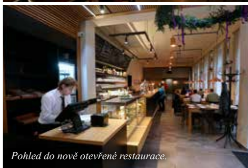
K textu na straně 12