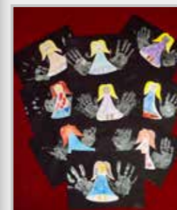
Fotografie na titulní straně časopisu: Andělé (práce dětí MŠ Chorušice)

Fotografie bez uvedení autora Jana Michálková a Miroslav Zelenka