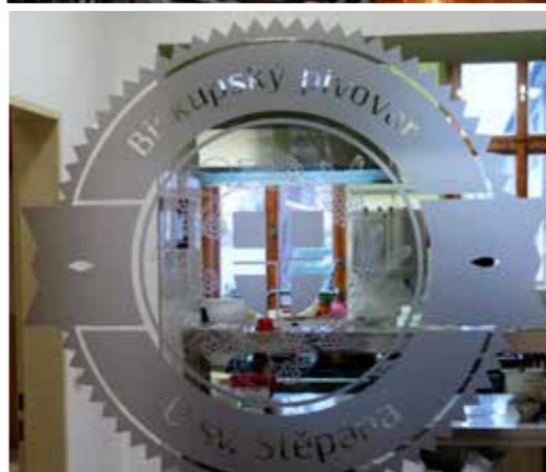
Část pivovaru, ve které probíhá kvašení piva.