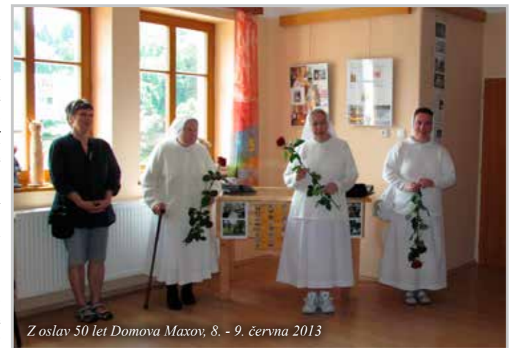
Z oslav 50 let Domova Maxov, 8. - 9. června 2013

Na zámečku ve Smržovce je výstava, historické fotky, věci [do 7. července 2013 – pozn.red.]. Když jsme se tam byly v sobotu podívat, říkaly jsme si, že to je poděkování. Ty sestry, i když přišly s obavou, se strachem, nevěděly, do čeho jdou, jak jedna generace, tak druhá (já už jsme vědě-