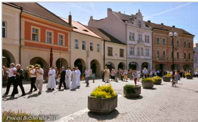
Procesí Božího těla 2010

Farnost využívá jedinečného umístění chrámu sv. Petra a Pavla nad soutokem Labe a Vltavy, zvonici vysokou šedesát metrů zpřístupnila veřejnosti jako vyhlídkovou věž. Umožňuje také turistům vstup do chrámu a do slavné kostnice, která se nachází v kryptě pod jeho kněžištěm a s pozůstatky 10 až 15 tisíc osob je spolu se sedleckou u Kutné Hory považována za největší v České republice. Farnost zaměstnává pro kostnici a věž průvodce.