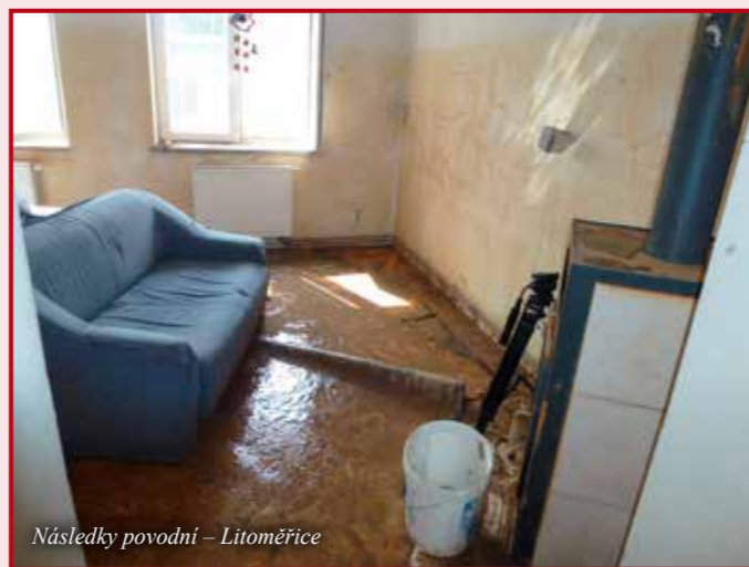
Následky povodní - Litoměřice