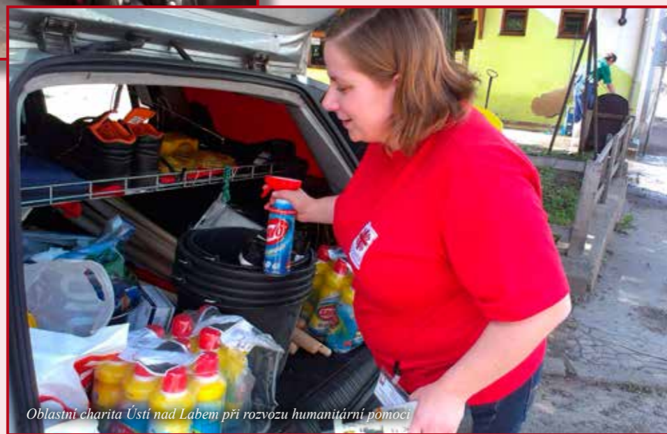
Oblastní charita Ústí nad Labem při rozvozu humanitární pomoci