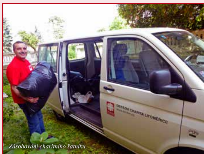
Zásobování charitního šatníku