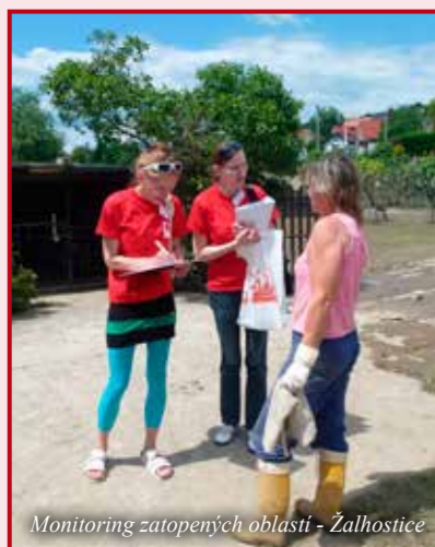
Monitoring zatopených oblastí - Žalhostice