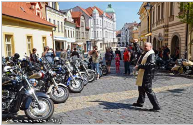
Žehnáni motorářům (2012)

kteří se přišli podívat na východ slunce. Jsou hotovi kdykoliv s čímkoliv pomocí, P. Zyzak to ilustruje slovy: „Rozbije se kamera, tak zvednu telefon a řeknu, Jirko, zase mi to nejde, a Jirka přijde a kameru opraví!“ Vloni pořídili pro věž ručně vázanou kroniku z vlastních prostředků. Zdaleka ne všichni z nich mají dar víry.