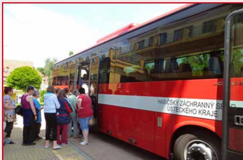
Návrat evakuovaných lidí domů