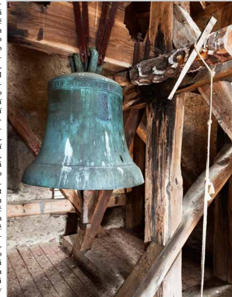
Zvonice v krušnohorském vikariátu