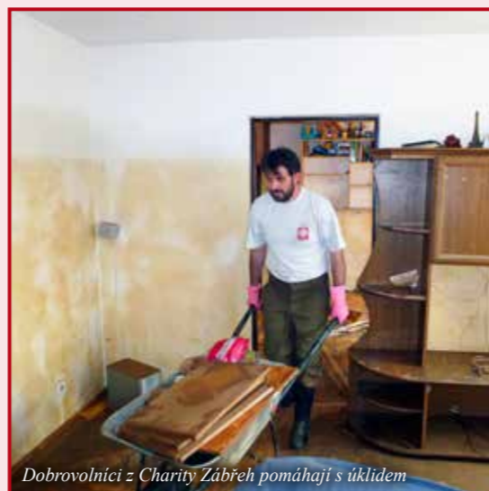
Dobrovolníci z Charity Zábřeh pomáhají s úklidem