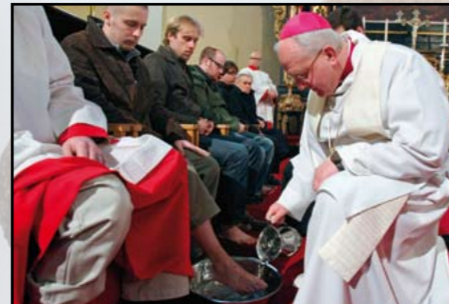
Zelený čtvrtek. Obřad mytí nohou.