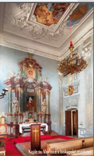
Kaple sv. Vavřince v biskupské rezidenci

Život našeho litoměřického biskupa začíná ve vrcholném baroku a jeho osobnost je jím značně ovlivněna. Neaktivnější část své lidské pouti prožívá ve druhé polovině 18. století, kdy se začíná formovat moderní evropská společnost a český národ stojí na počátku novodobého národního obrození. Valdštejn byl svědkem ústupu velké barokní doby a razantního nástupu generace, ovlivněné osvícenskými myšlenkami a ideály, volající po celospolečenských i církevních změnách. Musel se vyrovnat s vlivy jansenismu a těžce na něj dopadl josefinismus. Sledoval a účastnil se rozsáhlých reforem a viděl jejich dopad na církev a její život.