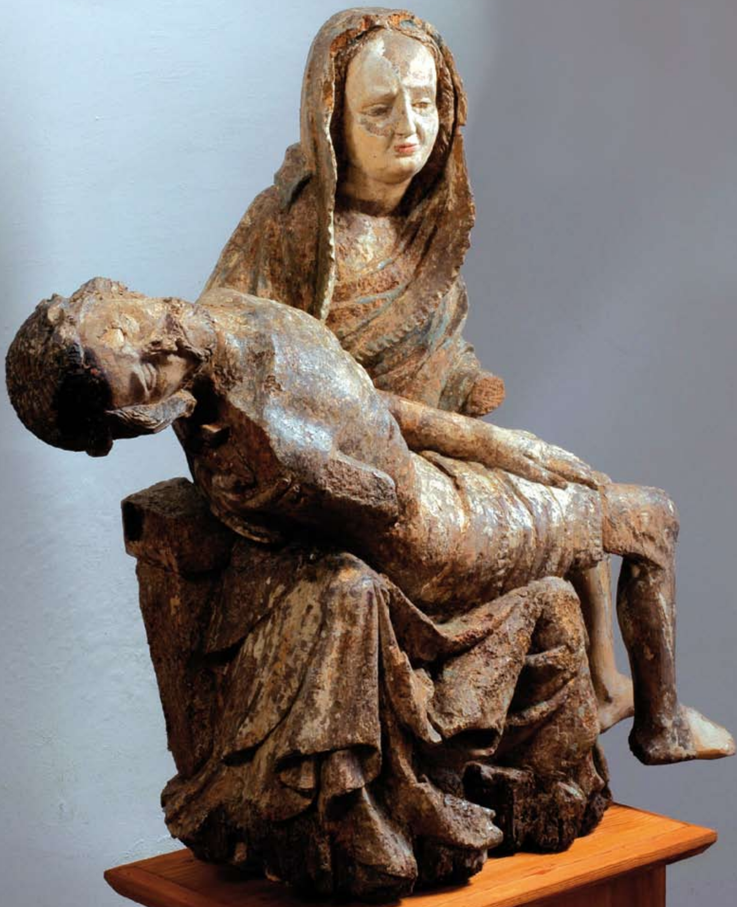
Pieta (konec 14. stol.)

Plastika ze sbírek litoměřického biskupství