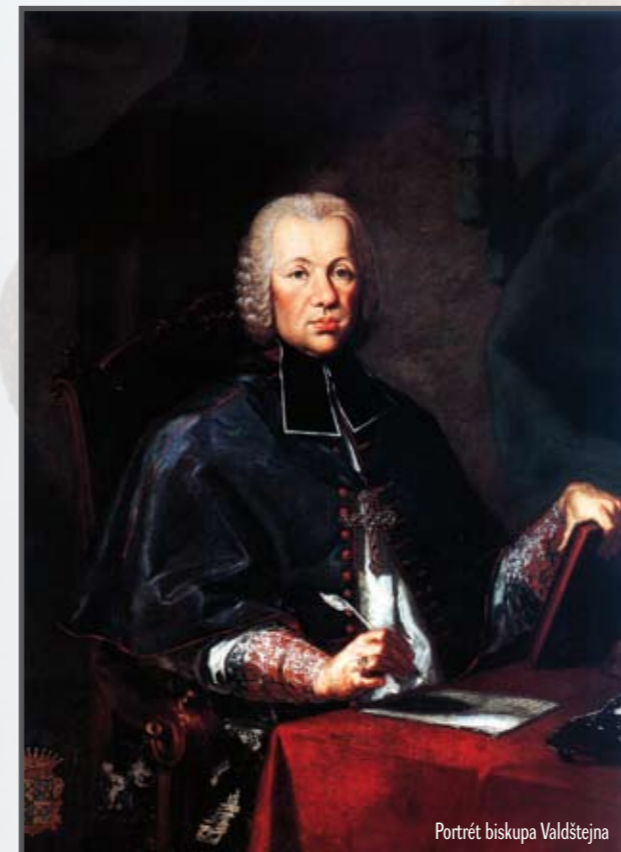
Portrét biskupa Valdštejna

V době hladomoru roku 1772 si Valdštejn vysloužil za pomoc potřebným přezdívku „otec chudých“. Věnoval se charitativní činnosti, známé je zejména zřizování fon-