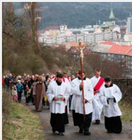
Z pouti