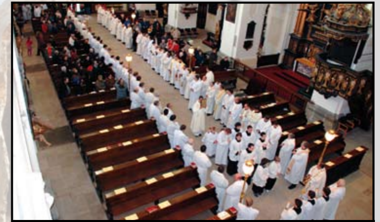
Missa chrismatis. Obnovení kněžských slibů.