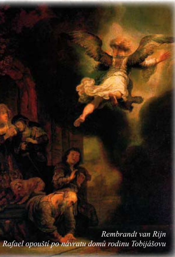
Rembrandt van Rijn Rafael opouští po návratu domů rodinu Tobijášovu

vším pro svůj etický rozměr týkající se hlavně rodinného života. Kniha vypráví o zbožném Židu Tóbitovi, který musí žít v cizí zemi. Přesto, že je vzdálen svému domovu, a přesto, že mu to nepřináší žádný pozemský užitek, zůstává i v cizině věrný morálním a rituálním zásadám, které mu předkládá jeho víra. Sám o sobě svědčí v úvodu knihy: ... časťto jsem dával almužny svým pokrevním bratřim, svůj chléb jsem dával hladovějícím a svůj oděv těm, kteří