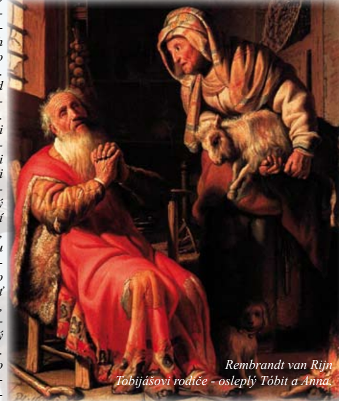
Rembrandt van Rijn Tobijášovi rodiče - osleplý Tóbit a Anna

dek lidské vytrvalé a trpělivé snahy. Nemocnému Tóbitovi je zdraví darováno jeho synem, ale ten získává lék na radu anděla po přemožení nebezpečné dravé ryby po dlouhém putování. Podobně Sára, budoucí Tobijášova manželka, je uzdravena duchovně osvobozením od démona Asmodea po mnohém strádání, ve kterém se ocitla až na pokraji sebevraždy, modlitbou a důležitou pomocí budoucího manžela, který podává lék získaný na radu anděla. Jádrem a pramenem veškerého zdraví, tohoto nutného předpokladu pro naplně-