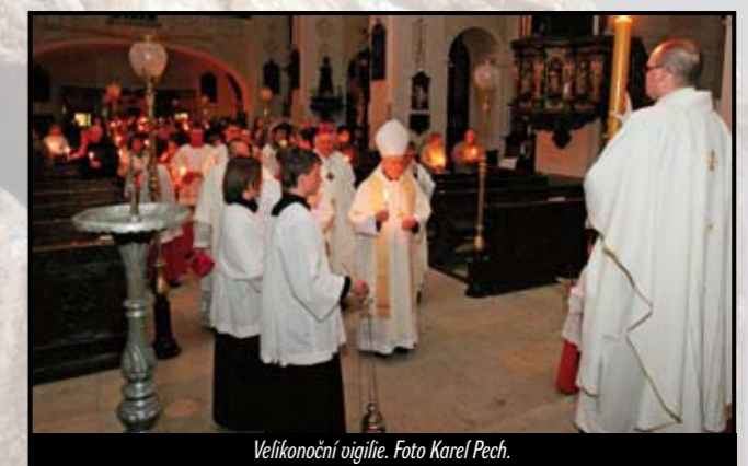
Velikonoční vigílie.