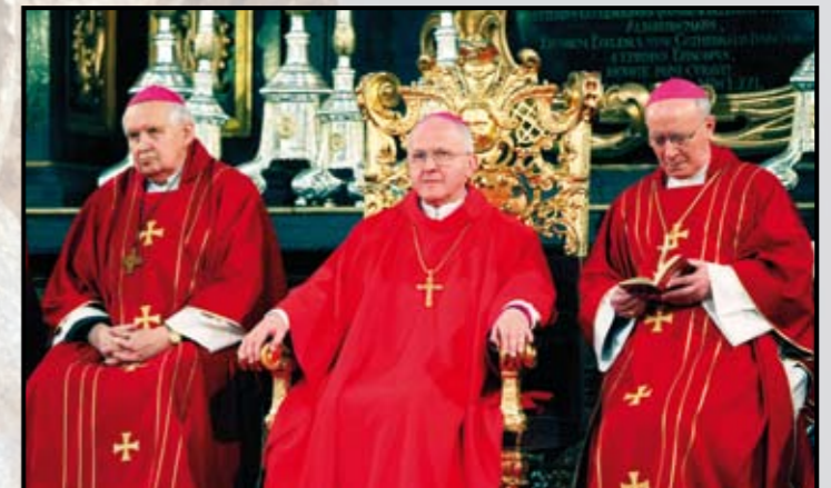
Velký pátek. Velkopáteční obřad v katedrále sv. Štěpána.