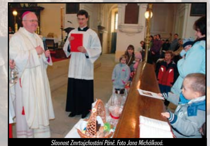
Slavnost Zmrtvýchstání Páně.