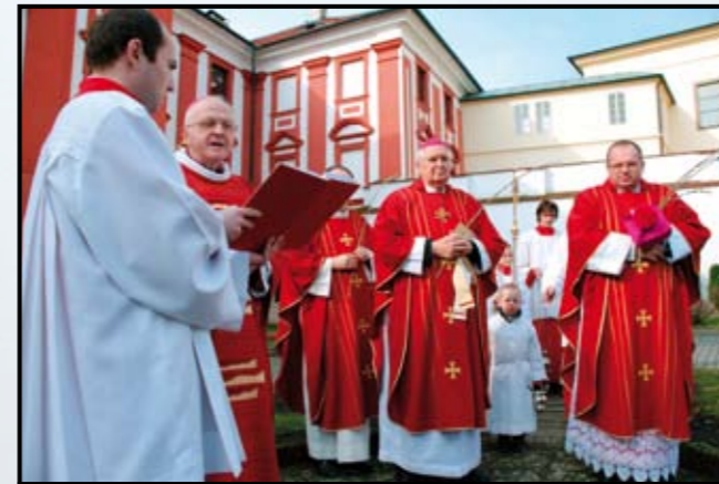
Koňná neděle. Žehnání ratolestí a průvod.