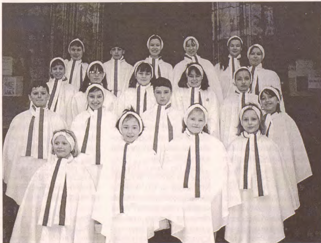
Dětský chrámový sbor v Lounech