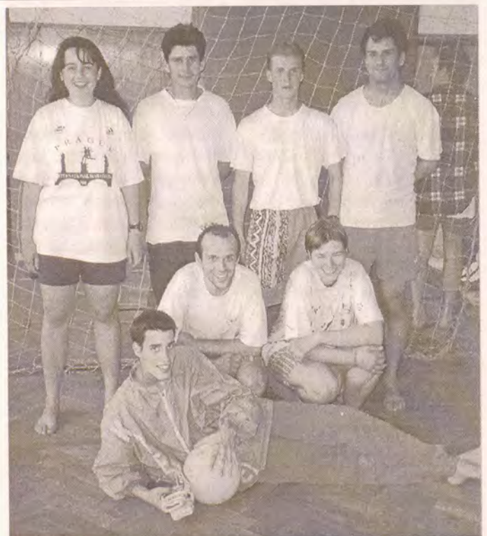
Vítězné družstvo Antiochie z Křešic